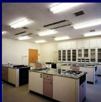
センターハウス 1F 定員 24名