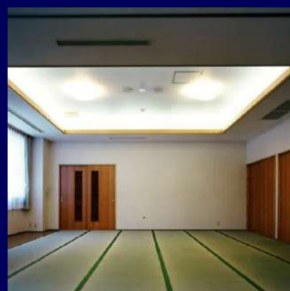
センターハウス 2F 定員 40名

※ご利用の場合は、1週間前までに予約が必要となります 詳細は下記までお問い合わせください