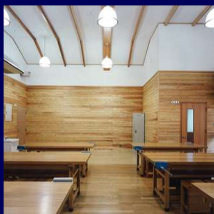
センターハウス 3F 定員 36名